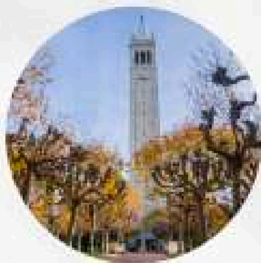
มหาวิทยาลัยแคลิฟอร์เนียเบิร์กลีย์