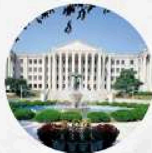
มหาวิทยาลัยแห่งชาติฮาร์วาร์ด