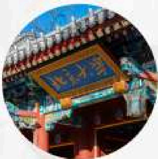
มหาวิทยาลัยปักกิ่ง