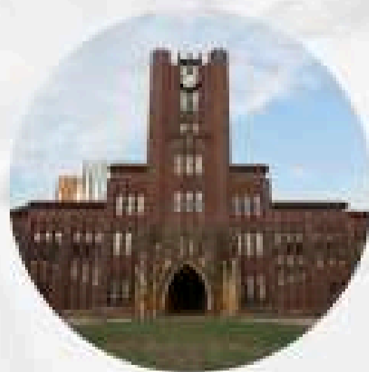
มหาวิทยาลัยโตเกียว