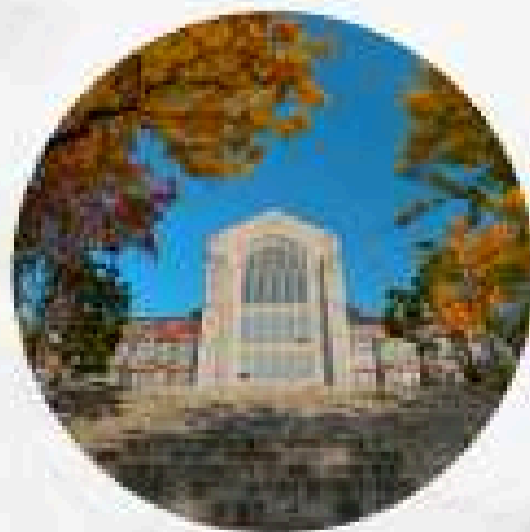
มหาวิทยาลัยสตรีจี้จว